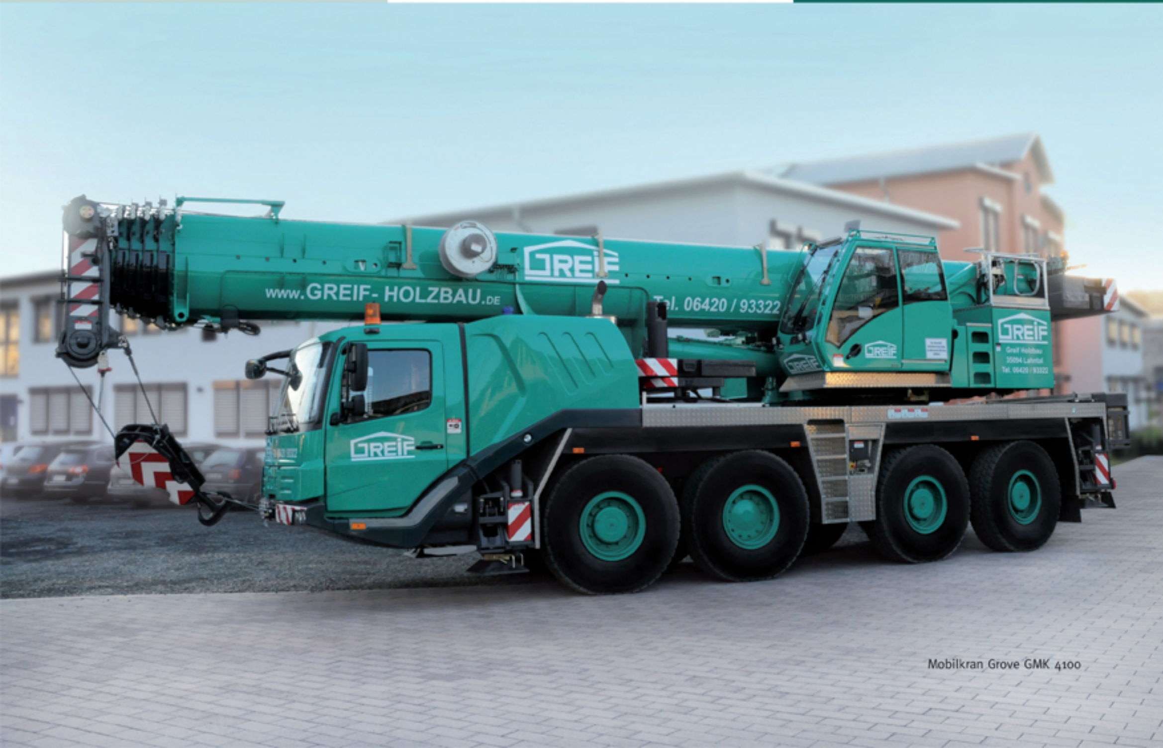
Mobilkran Grove GMK 4100

Wir verrichten Kranarbeiten bis zu einer Höhe von 82 m und einer Traglast von 100 Tonnen.